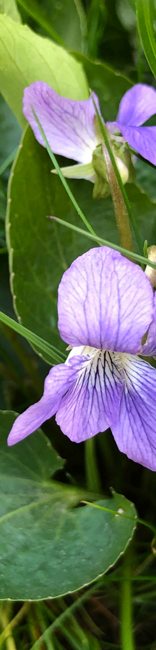
Illinois State Flower - Common Blue Violet