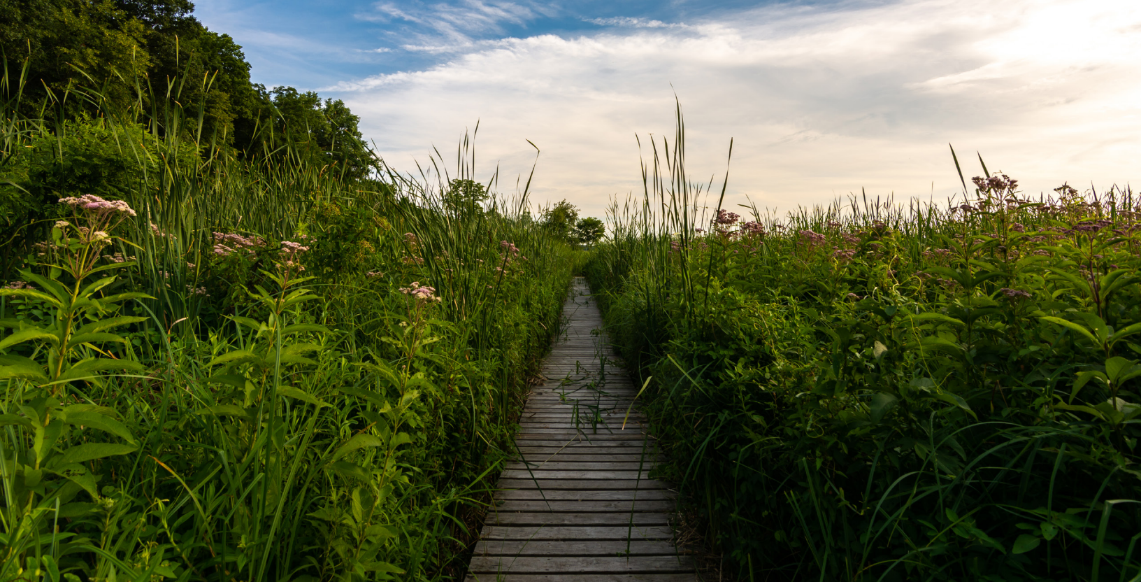
Dixon Waterfowl Refuge - Hennepin, Illinois

również, jak długo sprawca był księdzem lub bratem zakonnym, w porównaniu do całkowitej liczby księży i braci zakonnych w diecezji w danym okresie, pokazując stopień narażenia na kontakt z takimi sprawcami. Na końcu części poświęconej analizie danych znajduje się omówienie podobnych badań przeprowadzonych wcześniej przez Kościół Katolicki, pokazujące problemy zarówno z samymi badaniami, jak i danymi, na których się opierały.